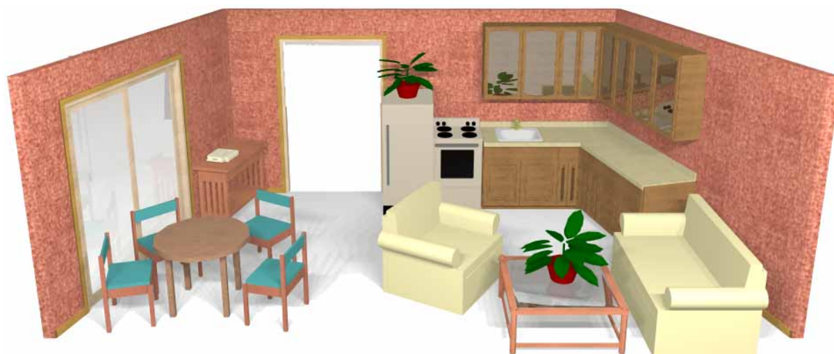
Représentation schématique du décor.

Une ouverture au centre du fond de scène qui emmène vers cour à l'entrée de l'appartement et pour le côté jardin vers la salle de bain et la chambre. A droite de cette ouverture, commence le coin cuisine qui se termine milieu côté cour, réfrigérateur, gazinière, plan de travail et meubles de rangement. En avant-scène côté cour, un canapé trois places qui termine le côté cour. Devant le canapé, une table basse et un fauteuil légèrement tourné vers le public. Une porte-fenêtre en avant-scène côté jardin qui mène à la terrasse. Devant la porte fenêtre une table de salle à manger et ses chaises.